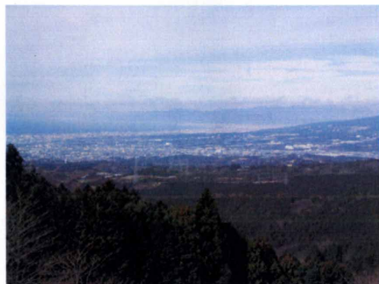
山中城西の丸下から望む駿河湾

漏れ伝わるところによれば、「笹原・山中バイパス」は、「山中城の西の丸」の外側を、ぐるっと迂回するように計画されているという。