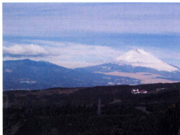
山中城西の丸下から望む富士山

もともとこの地点に出城が築かれたのは、韮山・足柄の出城とともに、駿府・沼津方面から押し寄せてくる敵を一早く発見するため、それ故に、一番高い西