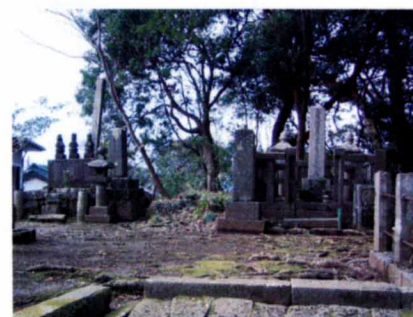
宗閑寺には両軍の将が共に弔われている