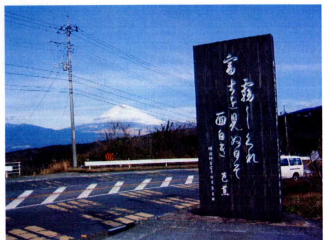
バスの乗降場所にふさわしい富士見平の芭蕉の句碑

芭蕉が、「霧しぐれ富士を見ぬ日ぞ面白き」と詠んだ通り、この西坂は「日本一の絶景だ」と言いながら、雲や霧や雨、また晴れていても富士