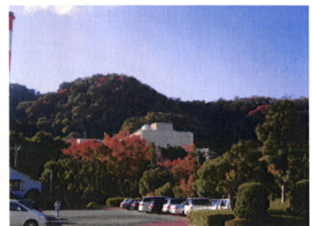
沼津河川国道事務所からの香貫山の紅・黄葉も美しい