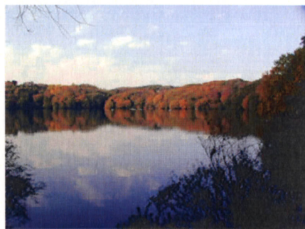
湖面に映るシルエットに幻惑されそうな一碧湖