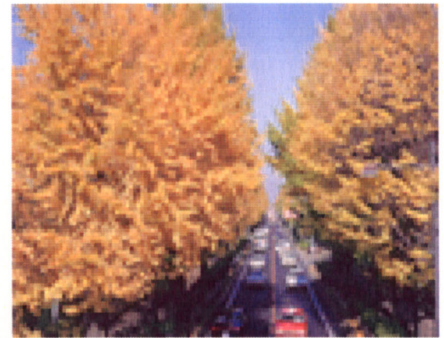
三島市文教町のイチョウ並木

どうしてかといえば、理由は簡単で、要するに「暖国」ということは、紅葉がないということではなく、つまりは紅葉が日本一遅く色づくということであり、実際に熱海の「梅園」では、11月中旬から12月上旬にかけて、カエデ・モミジの紅葉が園内を彩