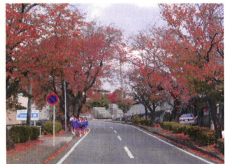
遺伝学研究所へ続く桜並木の紅葉