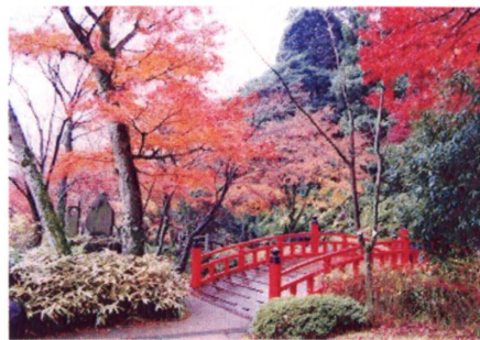
11月中旬から12月下旬にかけてライトアップされる熱海梅園

――まだまだ紅葉が足りないというのなら、京都の神社・仏閣を見習って、計画的・効果的に紅葉樹