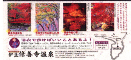
スケール大きな紅葉を知らせる修善寺の「もみじまつり」のパンフレット