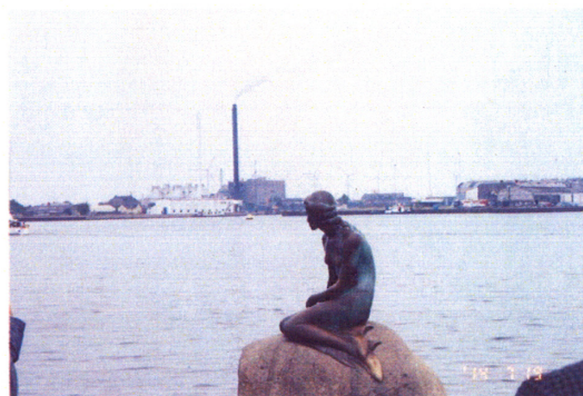
観光資源である「人魚像」の真後ろにある風力発電施設