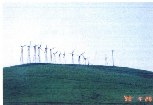
産油国の米国ですら、はるか昔から風力発電が行われている